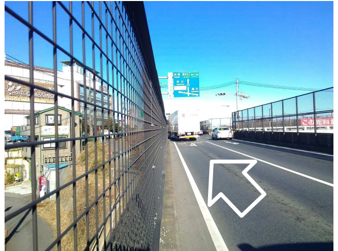
① 北方面 片側二車線 右折レーンなし