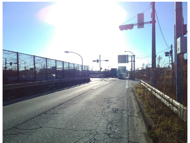
⑤ 南方面 片側二車線