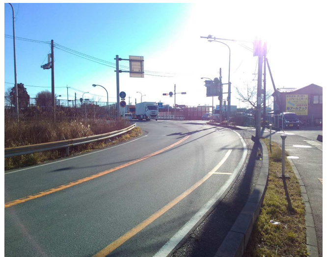
③ 東方面 片側一車線