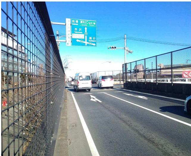
② 北方面 片側二車線 右折レーンなし