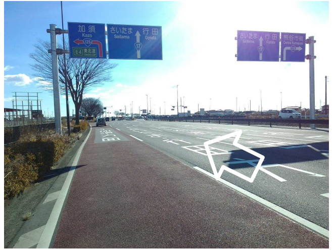
① 南東方面 片側三車線 右折・左折レーンあり