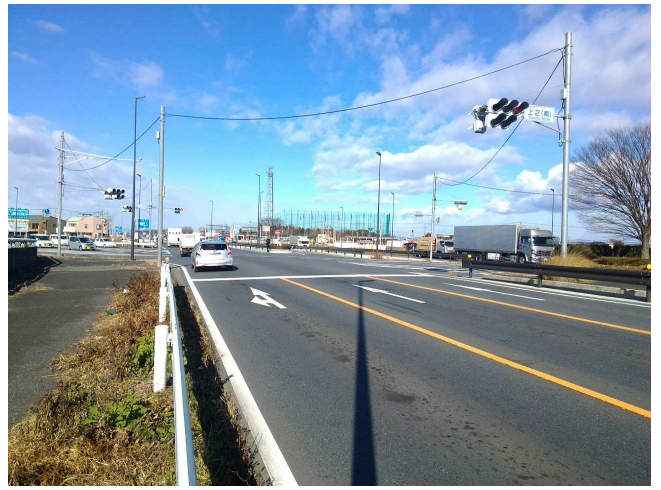
③ 北西方面 片側三車線 右折・左折レーンあり