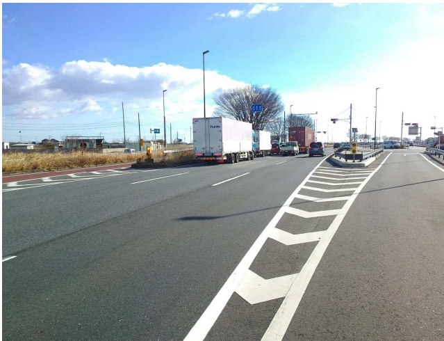
② 南東方面 片側三車線 右折・左折レーンあり