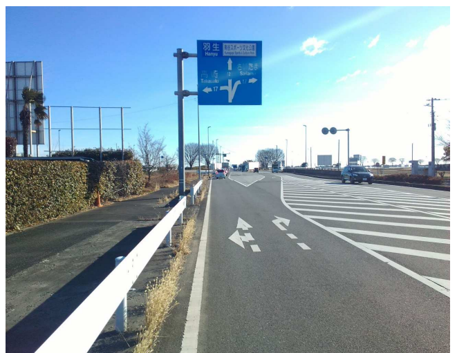
⑤ 東方面 片側一車線 右折レーンあり