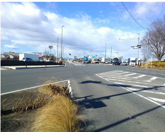
④ 西方面 片側一車線 右折レーン二車線あり