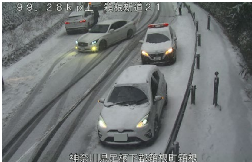
(令和6年2月25日 国道1号 神奈川県箱根町)