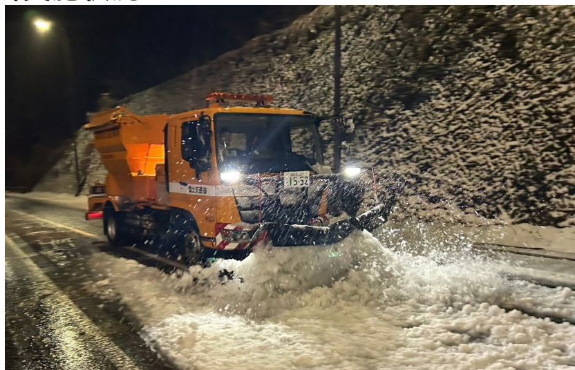
(令和7年3月5日 国道1号 神奈川県箱根町)