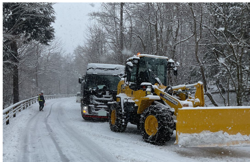
(令和6年2月5日 国道139号 山梨県鳴沢村)