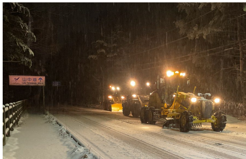
(令和6年2月29日 国道138号 山梨県山中湖村)